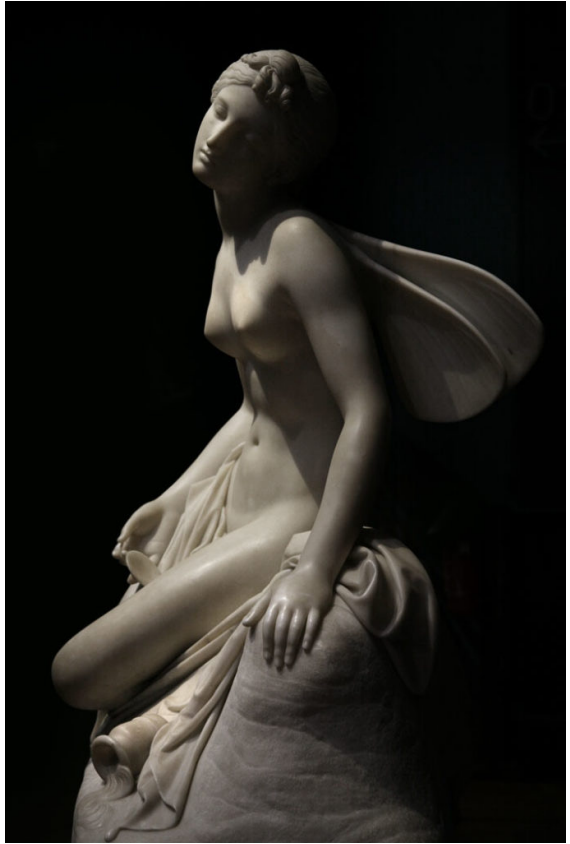
Pietro Tenerani, Psiche svenuta (1823)

Opere sospese, liberate dalle passioni e immerse in una calma sublime. A proposito della Psiche svenuta (1823) e dell' Apollon Musagète (1927-1928) gli autori, Pietro Tenerani e Igor Stravinsky, hanno magistralmente levigato la materia per recuperare un'ispirazione legata all'arte antica, quella più lineare, mirando come per una sfida alla perfezione assoluta. Non può che essere così per Stravinskij pensando in termini musicali al dio delle arti: infatti in Apollon Musagète "balletto bianco" purifica e prosciuga il discorso tenendo una costante monocromia timbrica. "Neppure gli urti dissonanti producono violenti effetti dinamici" (Roman Vlad). Ma mentre per lo scultore resta una convinzione assoluta, per il musicista diventa un gesto provocatorio come era stato, dieci anni prima e per motivi contrari all' Apollon , Le Sacre du Printemps .