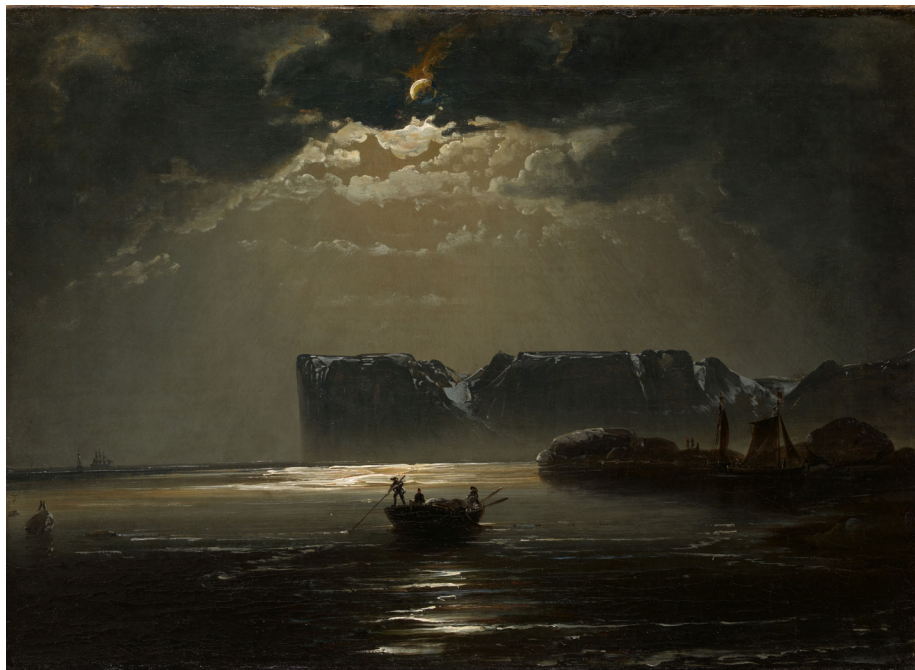
Peder Balke, Capo Nord (1848)

Immersi nella dimensione del sublime, i paesaggi norvegesi di Peder Balke - in riferimento al dipinto intitolato Capo Nord (1848) - e la musica del Concerto per pianoforte di Edvard Grieg, inevitabilmente ci catturano, complice un gioco chiaroscurale che giunge quasi a un punto di rottura. Entrambi, pur avvertendo la presenza di forze ingovernabili e, consapevoli che in questi paesaggi “ i figli della natura (gli umani) svolgono solo un ruolo minore ” (cit. Balke), non rinunciano a ritagliarsi meravigliosi momenti di poesia intima. Mentre si dipana il racconto soggettivo, la natura esterna diviene una cosa sola con le visioni individuali, con l’anima di ognuno. Così, quando udiamo la melodia popolare dell’ultimo tempo del Concerto , non sappiamo se sia vera o se sia il canto di uno di quei soggetti sulla barca.