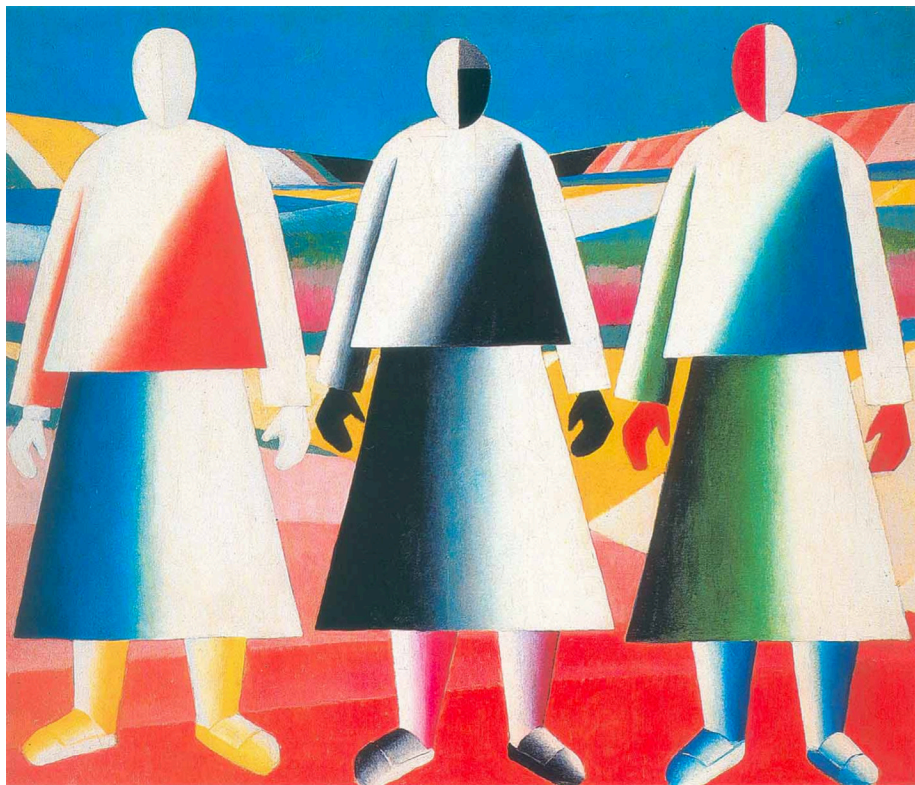
Kazimir Malevič, Ragazze in un campo (1928-29) - Olio su tela 106 x 125 cm | Museo di Stato Russo, San Pietroburgo)