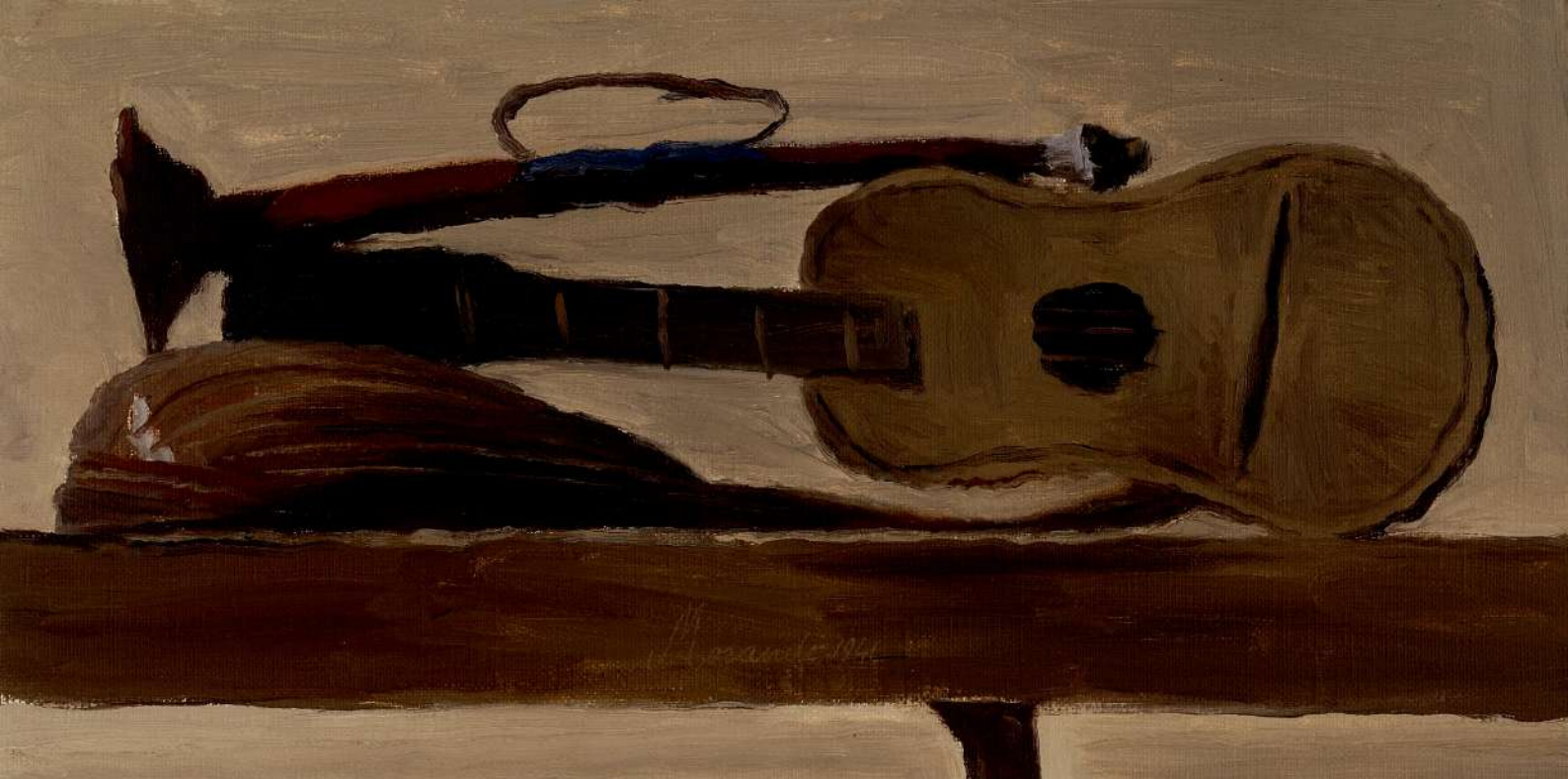
Giorgio Morandi, Natura morta con strumenti musicali , 1941, olio su tela cm 27 x 52,5, Inv. 589, Fondazione Magnani Rocca, Mamiano di Traversetolo