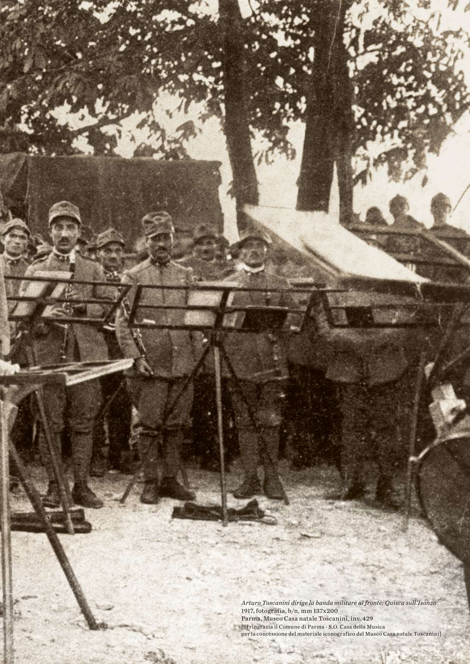
Arturo Toscanini dirige la banda militare al fronte: Quisca sull'Isonzo 1917, fotografia, b/n, mm 137x200 Parma, Museo Casa natale Toscanini, inv. 429 [Si ringrazia il Comune di Parma - S.O. Casa della Musica per la concessione del materiale iconografico del Museo Casa natale Toscanini]