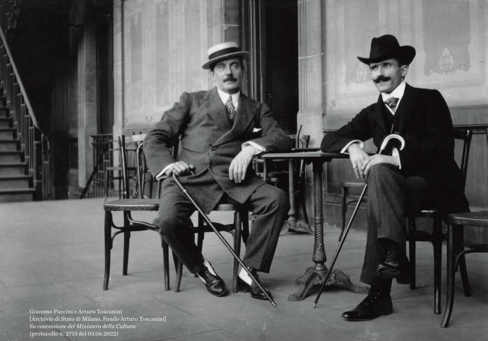
Giacomo Puccini e Arturo Toscanini